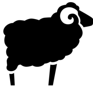
Created by Norman Ying from Noun Project