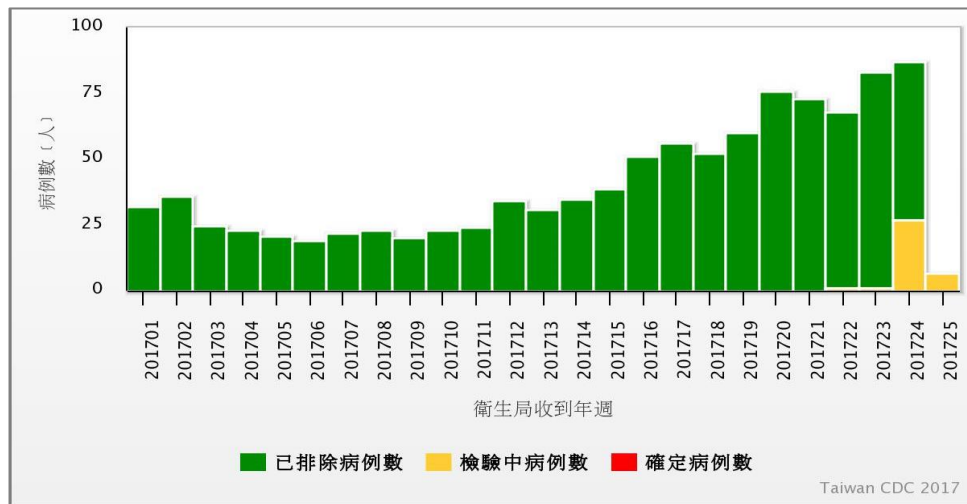
圖三、2017年登革熱本土病例通報趨勢