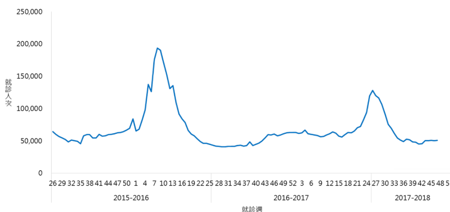
圖二、近三個流感季類流感門急診就診人次趨勢