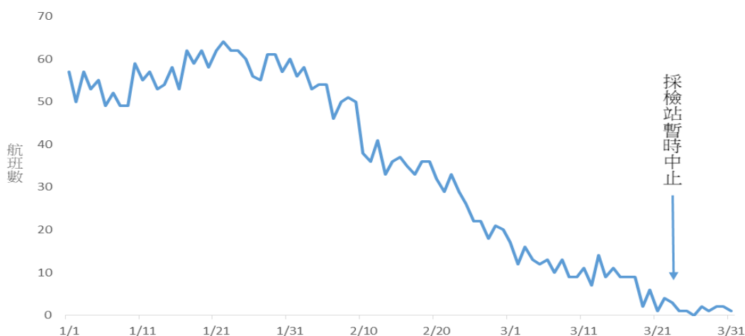
圖四、高雄國際機場 2020 年 1 月至 2020 年 3 月航班數

採檢站每日需徵調 6 位醫護人員執行就地採檢作業，因應航班及入境旅客數減少，為免耗用醫護人力及考量成本效益，經與主責醫院陳堃生指揮官討論評估後，決定於 3 月 23 日起暫停高雄國際機場就地採檢措施，有症狀旅客調整由機場後送至合約醫院診察機制運作。