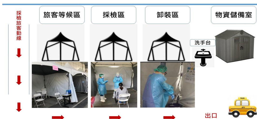
圖二、就地採檢站配置及旅客動線