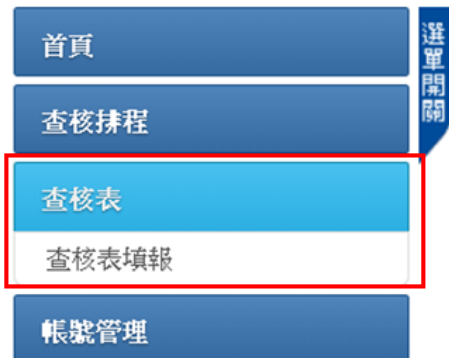
(LTC0601) 查核表 - 查核表填報 - 查詢列表

(1) 線上版填報：由查核委員/地方主管機關透過有網路之裝置，進入系統，點選左方功能列中「查核表」項下「查核表填報」，於功能欄位點選「填報」按鈕，進入之介面，如下圖所示：