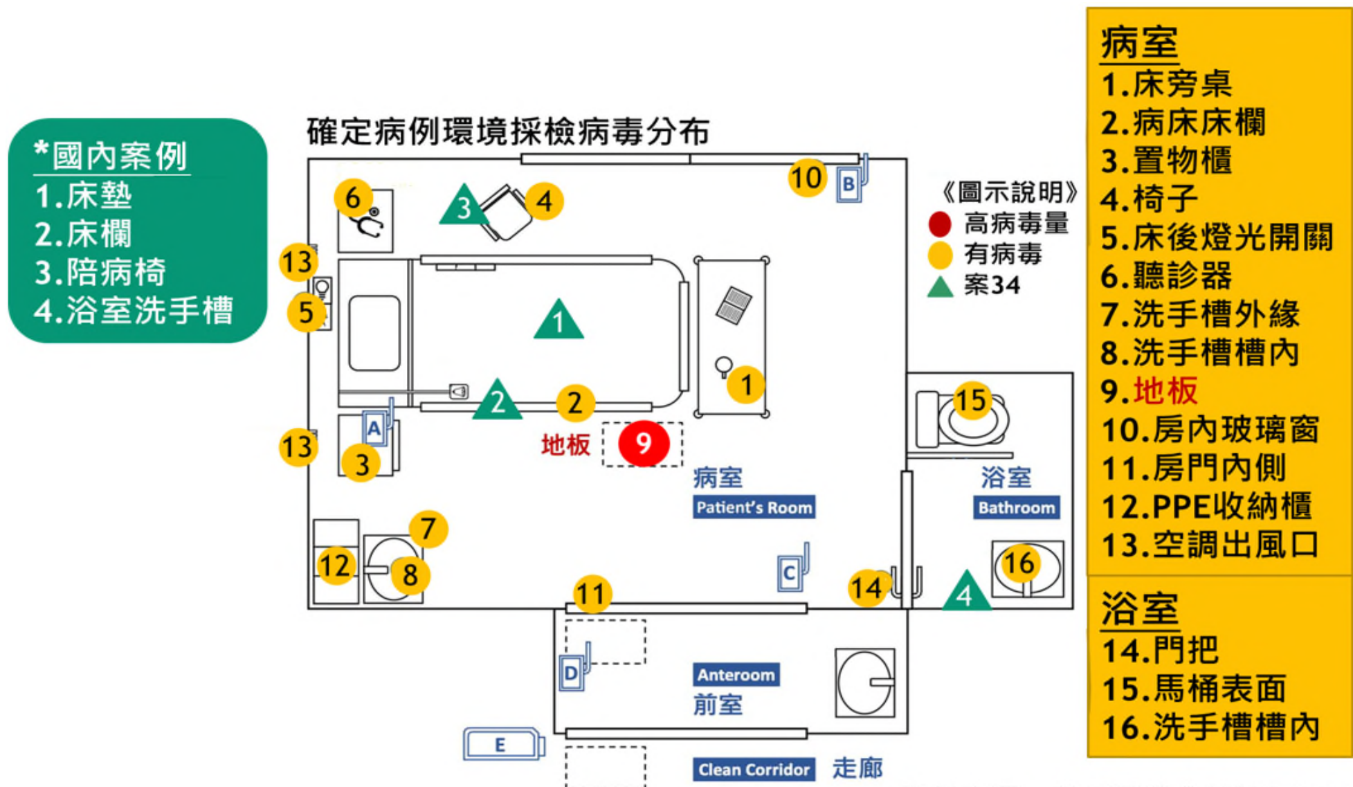
圖二、確定病例环境採檢病毒分布