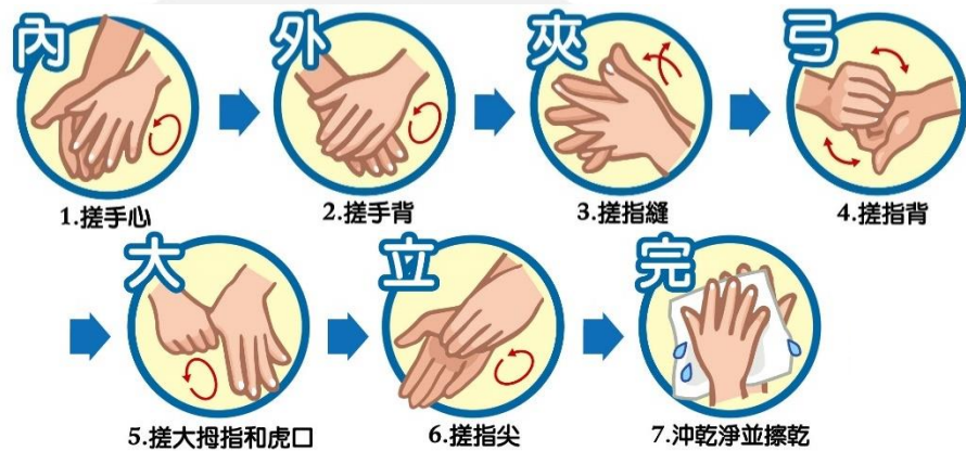
圖二、洗手 7 步驟