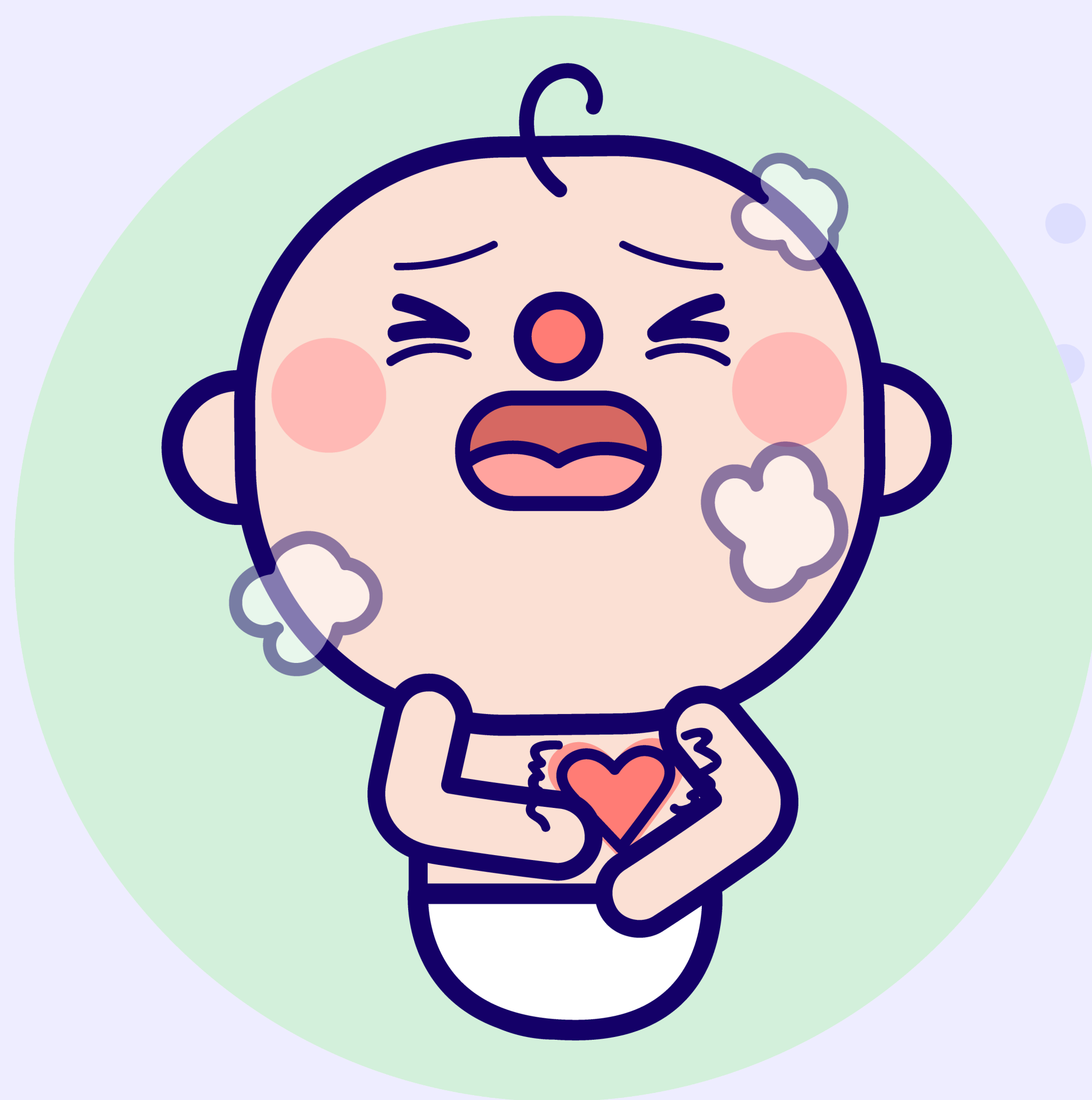
呼吸急促或心跳加速