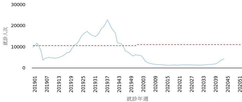
圖三、2019–2020 年腸病毒門急診就診人次趨勢