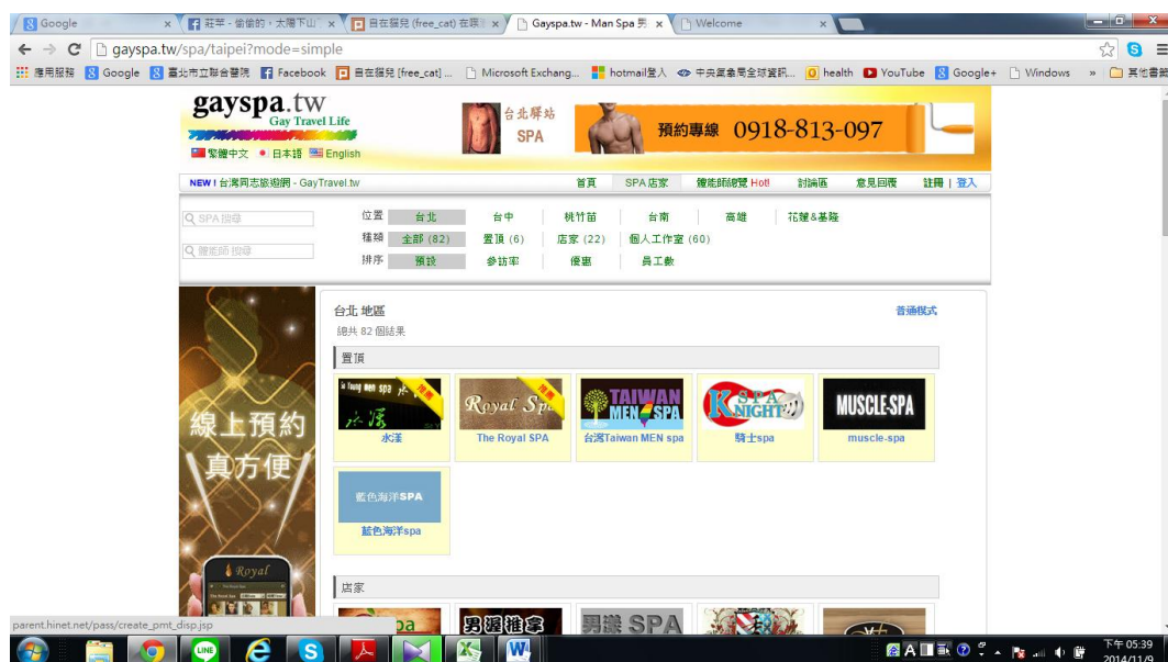
圖一、男男按摩店網路平台—GAYSPA

括了 28 個店家及 118 間個人工作室（個工），是台灣男男按摩店資料最完整的網站。根據訪談 SPA 師傅及 SPA 店家表示，他們的廣告多半是在網站上買廣告，客人會在網站上選擇師傅的照片，再經由所留的電話聯繫店家，約好之後再到現場消費；少數客人也會直接到店家現場，那就要看現場是否有值班師傅、師傅是否有空才能接客，若真的沒有師傅有空，有時店長自己也能接客，或只好請客人改天再上門。