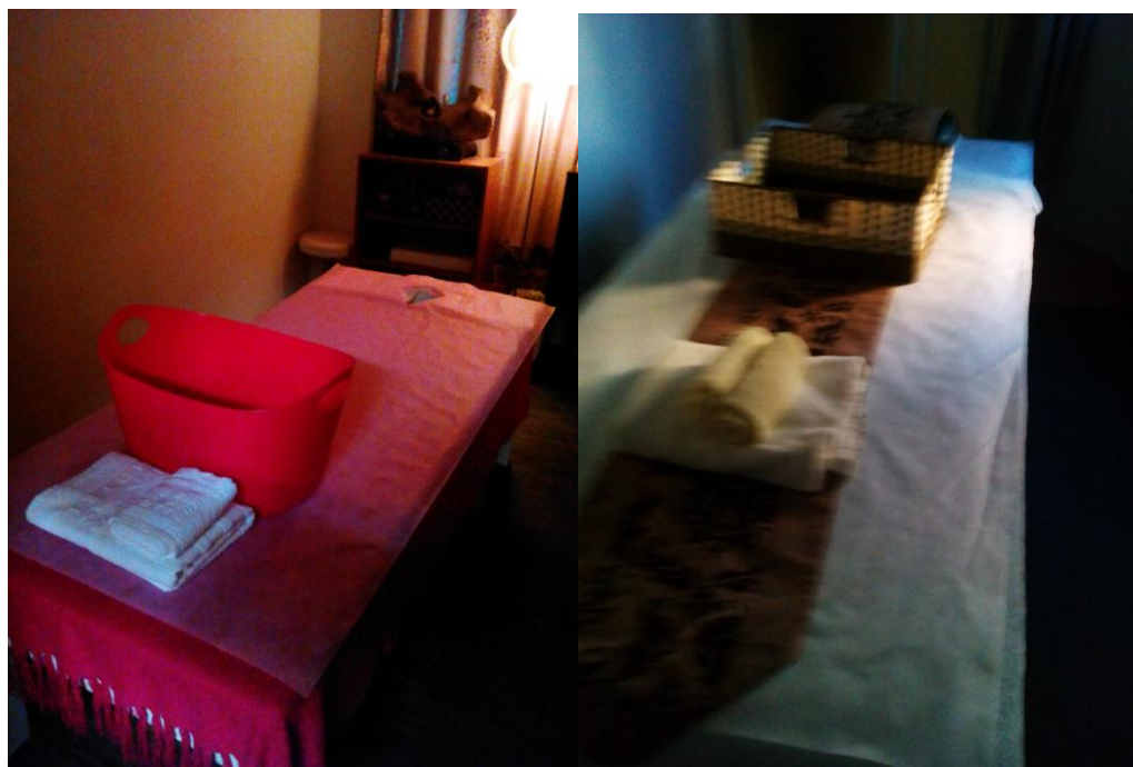
圖二、同志 SPA 店內擺放

工作時需要的物品。此外，是否在房裡有自己的衛浴則視店家的規模而定，但若衛浴是在房間之外，師傅也會先行走出房間“清場”，確定走道上沒有他人，才會請客人走到浴室。