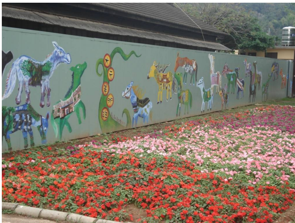
圖一、后里馬場增設彩繪圍籬