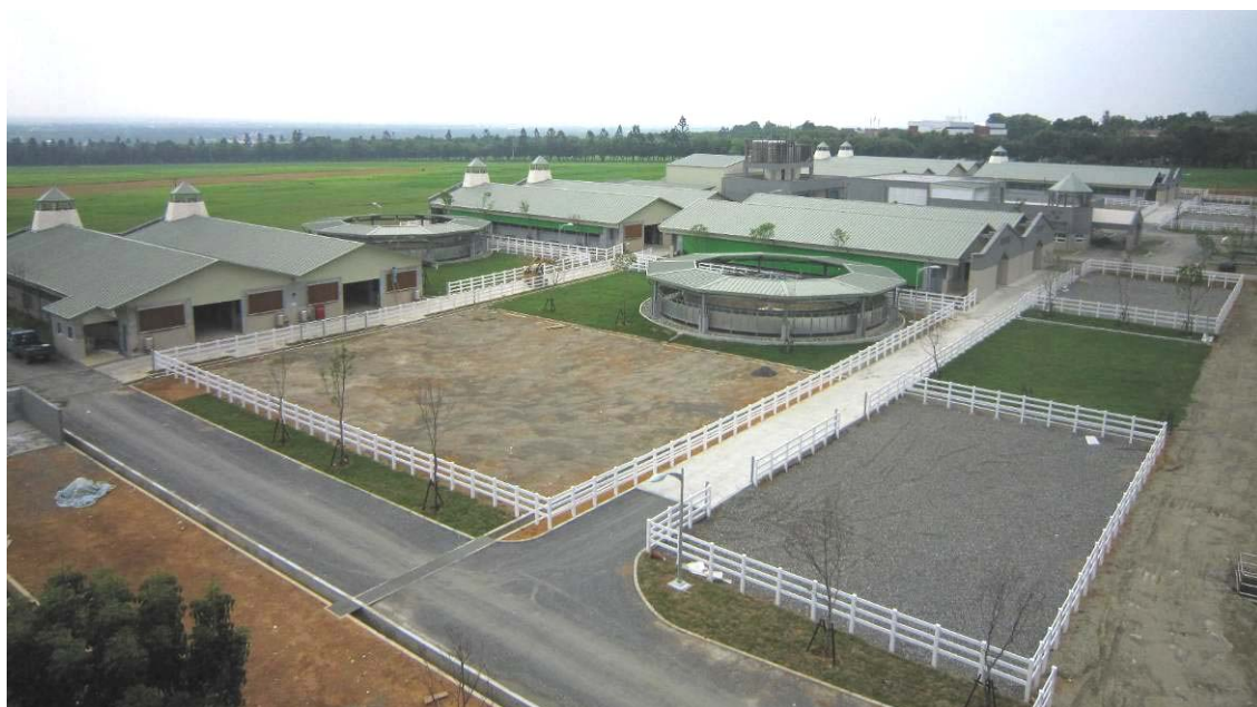
圖二、我國第一座符合cGMP之免疫馬場