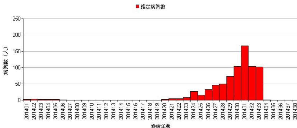
圖一、2014 年本土登革熱確診病例趨勢