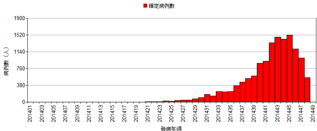
圖一、2014 年本土登革熱確診病例趨勢