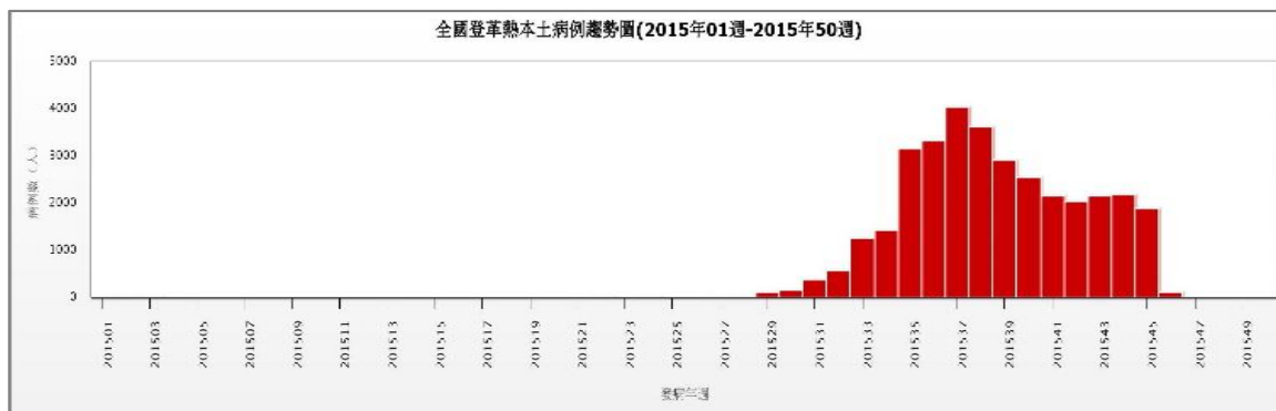
圖二、2015 年登革熱本土確定病例趨勢