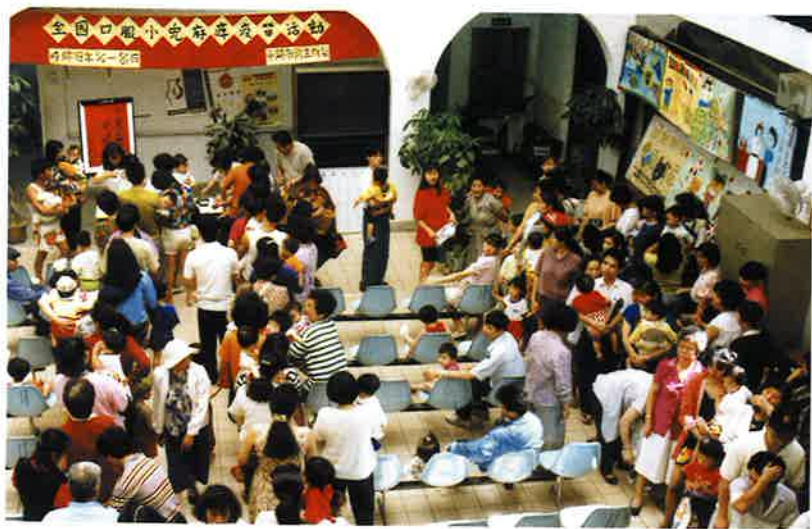
▼全國疫苗日活動期間，平鎮鄉衛生所大廳的口服站，大批民眾帶著幼兒前往口服小兒麻痺疫苗。