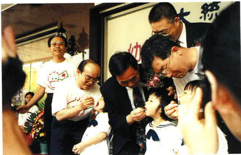
▼高雄市大統百貨前口服站現場，由吳敦義市長主持，陳瑩霖副署長、防疫處張耀雄處長、高雄市衛生局江英隆局長給小朋友口服小兒麻痺疫苗（右起）。