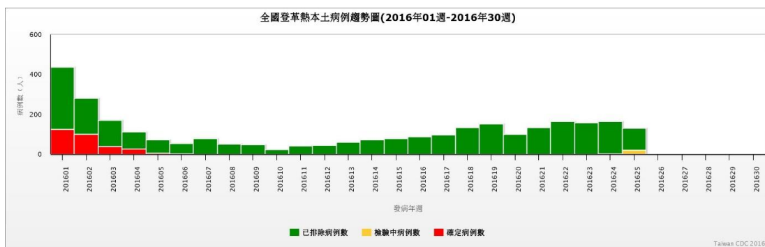
圖二、2016 年登革熱病例趨勢