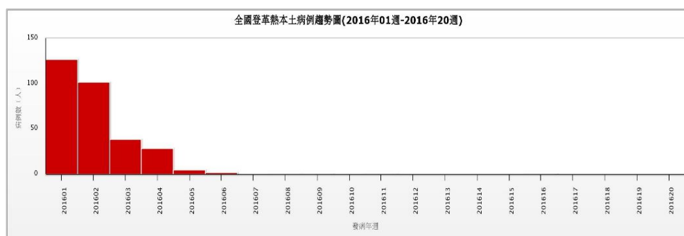
圖二、2016 年登革熱本土確定病例趨勢