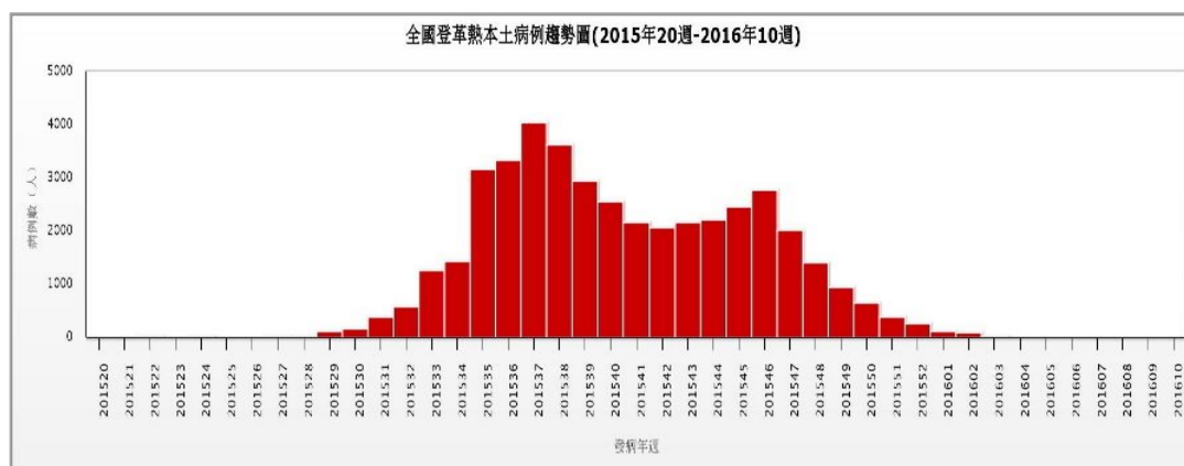
圖二、2015 年登革熱本土確定病例趨勢