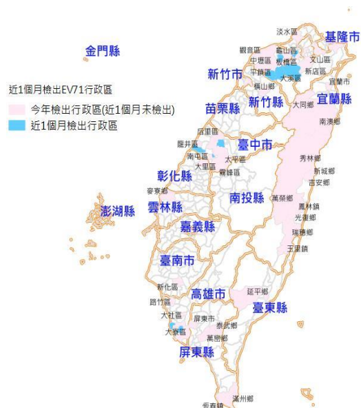
圖二、2016 年檢出腸病毒 71 陽性及重症個案分布