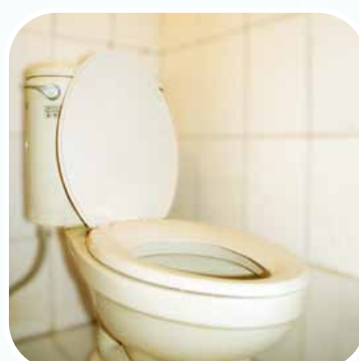
Pagkatapos Gumamit Ng Banyo