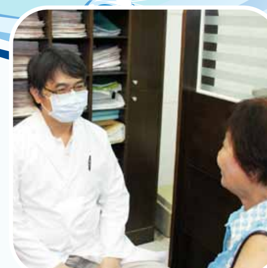
Pagkatapos Komunsulta Sa Doktor ...At Iba Pa