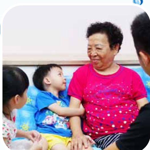
Bago At Pagkatapos Humawak Sa Pasyente