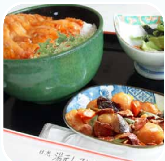
ก่อนรับประทานอาหาร

ข้อบ่งชี้ในการล้าง มือของบุคคล โดยทั่วไป