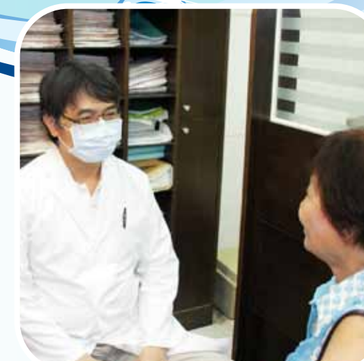
หลังจากตรวจโรค เป็นต้น