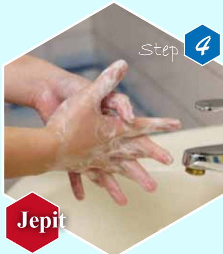
Step 4 Jepit Gosok sela-sela jari