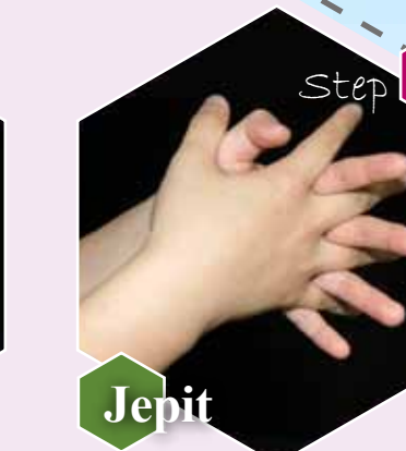
Step 4 Jepit Gosok sela-sela jari