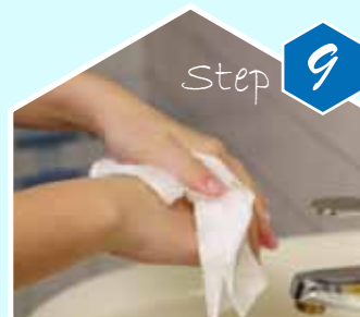
Step 9 Keringkan tangan dengan handuk/tissue