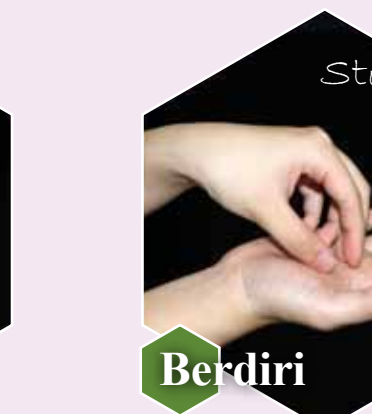
Step 7 Berdiri Gosok berputar ujung jari-jari tangan kanan ditelapak tangan kiri dan sebaliknya