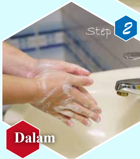
Step 2 Dalam Gosok telapak tangan