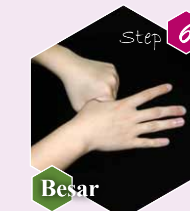
Step 6 Besar Ibu jari tangan kiri digosok berputar dalam gengaman tangan kanan dan sebaliknya