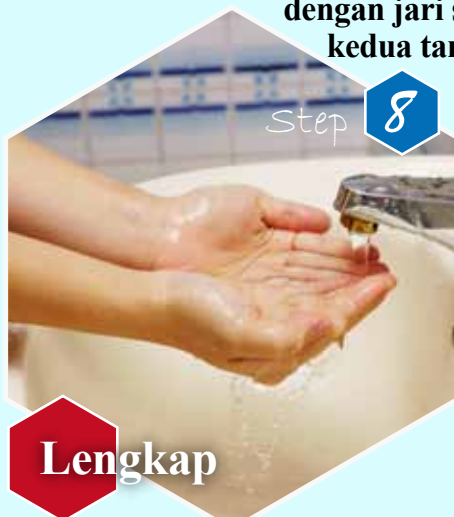
Step 8 Lengkap Bilas dengan air bersih