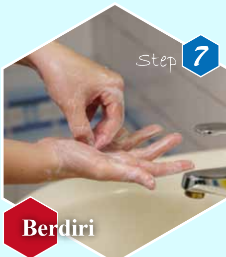
Step 7 Berdiri Gosok berputar ujung jari-jari tangan kanan ditelapak tangan kiri dan sebaliknya