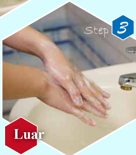
Step 3 Luar Gosok punggung dan sela-sela jari tangan secara bergantian