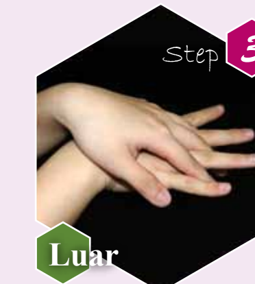
Step 3 Luar Gosok punggung dan sela-sela jari tangan secara bergantian