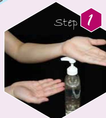
Step 1 Gunakan punggung tangan atau siku untuk mengambil 2-3ml alcohol (handrub)