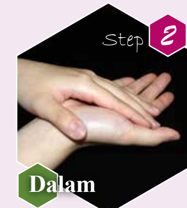
Step 2 Dalam Gosok telapak tangan