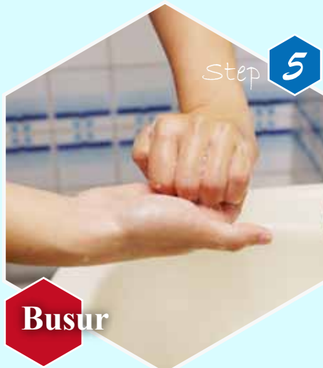
Step 5 Busur Punggung jari tangan kanan digosokkan pada telapak tangan kiri dengan jari sisi sebelah dalam kedua tangan saling mencuci