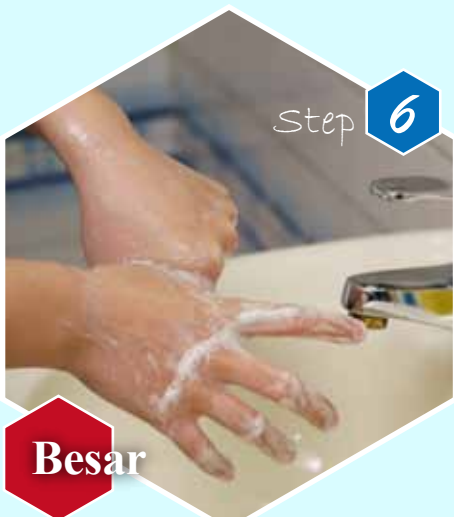
Step 6 Besar Ibu jari tangan kiri digosok berputar dalam gengaman tangan kanan dan sebaliknya