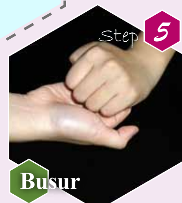
Step 5 Busur Punggung jari tangan kanan digosokkan pada telapak tangan kiri dengan jari sisi sebelah dalam kedua tangan saling mencuci