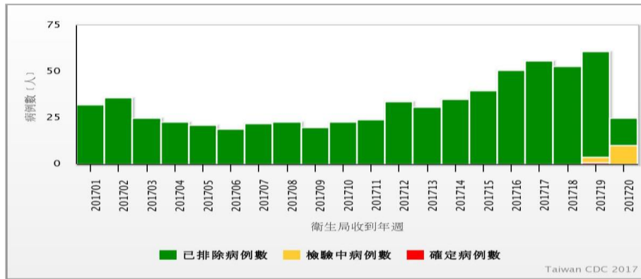
圖三、2017年登革熱本土病例通報趨勢