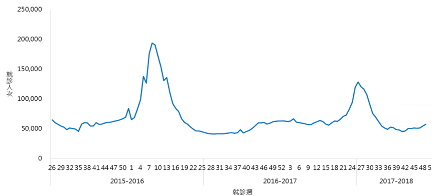
圖二、近三個流感季類流感門急診就診人次趨勢