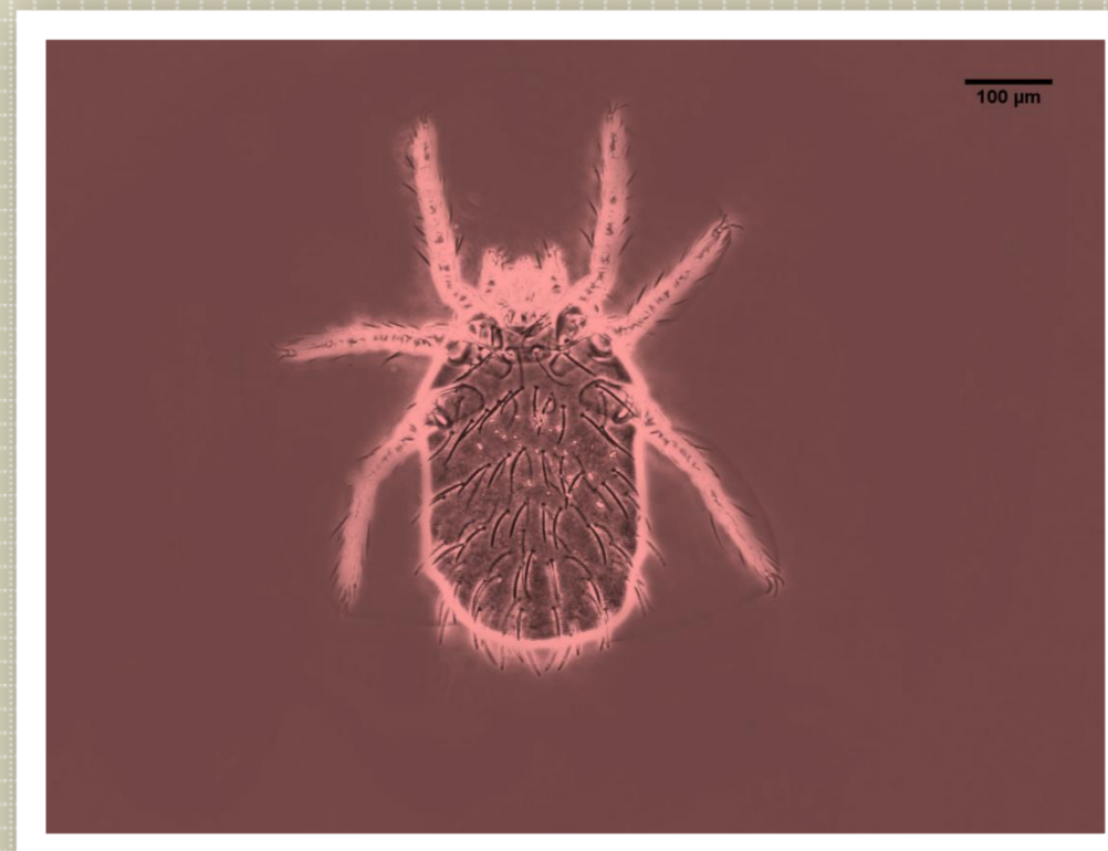
小板纖恙蟲 (金門縣冬季)