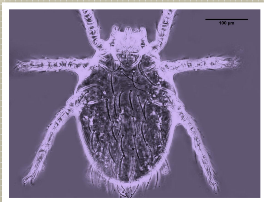
英帕纖恙蟲 (花蓮縣夏季)