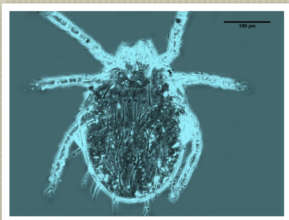
地里纖恙蟲 (臺灣夏季)