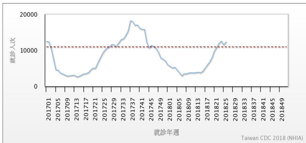
圖一、2017–2018 年腸病毒健保門急診就診人次趨勢