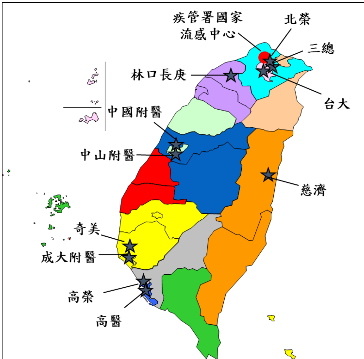
圖 1、111 年新型 A 型流感指定檢驗機構網絡圖