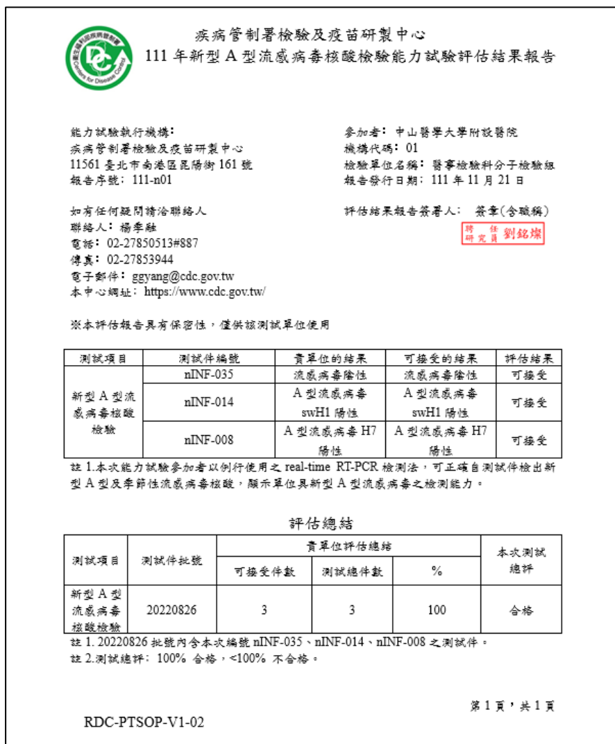
表 3、111 年新型 A 型流感核酸檢驗能力試驗評估結果報告(準 ISO 17043 模式)