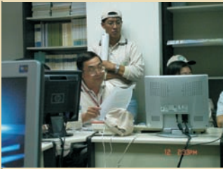
■ 每日查核後，工作報告填報