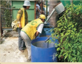
■ 菜園裡又有2個陽性容器