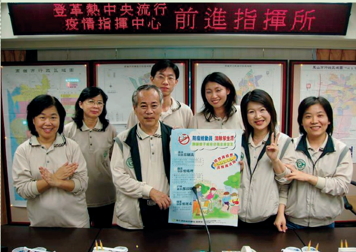
■ 黃科長展示清除孳生源海報

我將容器減量列入登革熱防治重視程度等級第二優先順序，因容器是蚊蟲孳生處，亦是成蚊棲息所，噴藥時它是掩體亦是庇護所；故容器減量其重要性不言可喻。而在理論基礎上，容器減量可間接促使病媒蚊密度降低，自然而然，四項變數超連結之機率亦會隨之減少，這也清楚說明容器減量能夠發揮遏止疫情持續擴大蔓延的效果殆無疑義。另證諸歷年疫情發生時，防疫工作人員對棄置於菜園與空地等之保麗龍與安全帽等容器，僅習慣性將積水中發現之子孑以滴管吸取置入所攜帶之小瓶中，然後將容器