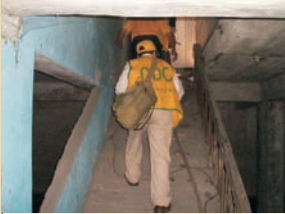
■ 地下室查核工作結束離開