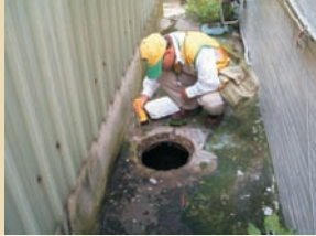
■ 連化糞池也不放棄檢查