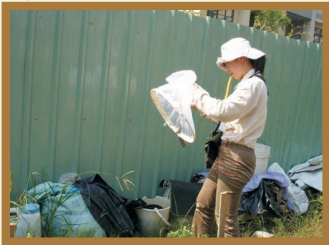
■ 掃蚊網捕蚊並辨識成蚊