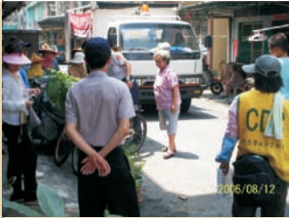
■ 警察同仁參與協助，感謝警察同仁協助維持秩序。