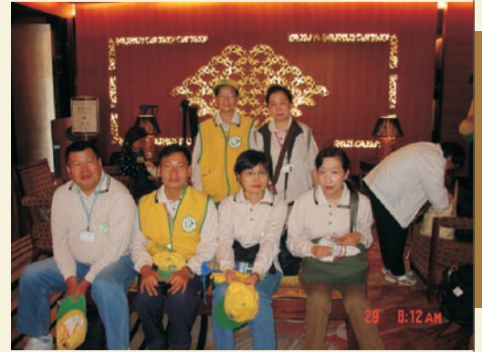
■ 等待車輛接送上戰場

進入高危險區，挨家挨戶從荒廢樓頂到陰暗地下室考驗我們的專業與體力，狹小防火巷、屋頂排水溝，更是考驗除了專業以外的膽量與飛簷走壁能力。這些人平常穿戴整齊，伏案提筆的，現在成了金庸筆下身懷金雁功的郭靖，翻牆、爬屋頂早成了家常便飯。雖然這是一場硬仗，但沙場老將所害怕不是強大的敵人，而是不能戰死沙場。望著這些多年老夥伴，沒有害怕，有的只是豔陽下驕傲的身影，我以他們爲榮。