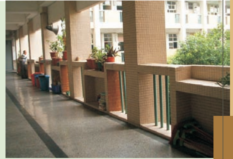
■ 學校走廊花盆擺放