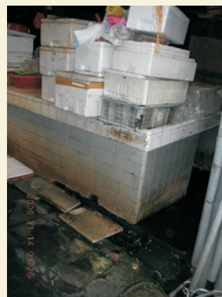
■ 廢棄寶麗龍盒堆積