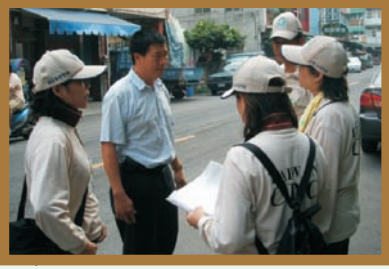
■ 與地方人士交換意見，瞭解病媒蚊蹤跡