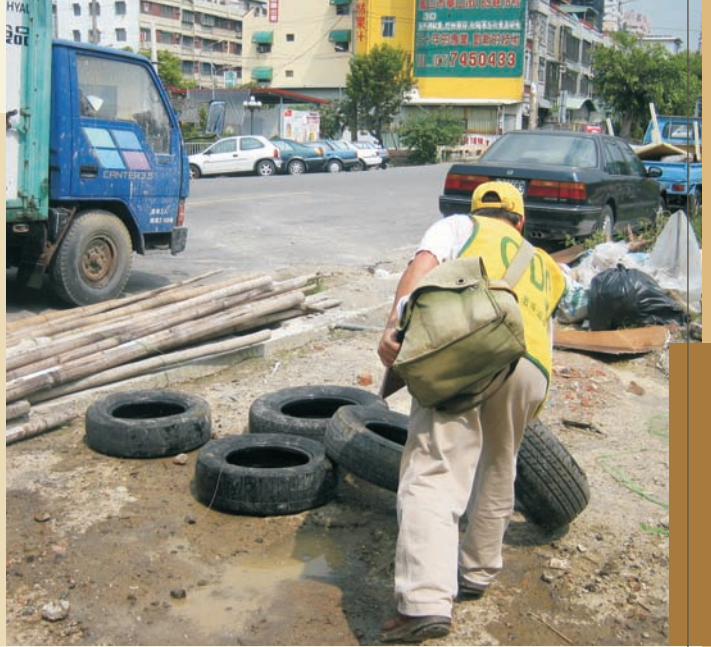
■ 路旁丟棄5個輪胎積水生子子