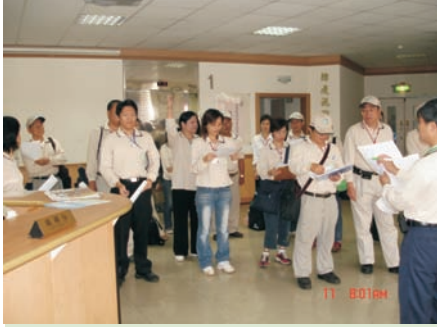
■ (上圖) 當日查核後檢討會蒐集情報，提供地方政府防治訊息。 ■ (下圖) 行前長官精神喊話及工作指示。

憶及往日的登革熱防疫工作，雖然還不至於血淚斑斑，但過程的辛苦仍是歷歷在目，尤其是支援工作的期間雖然是連續假期，但因為「防疫無假期」，所以即使在南部嬌陽的伺候下，仍然全日無休地執行登革熱的防治工作，雖然每晚回到宿舍時，已經精疲力竭地攤在床上，但內心很明確知道，這是很充實、很美好的一天，因為我們整個團隊都已經付出了最大的努力，或許貢獻是很微薄的，但長期累積的成果相信是無法抹滅的，因為我們都相信「凡走過必留下痕跡」。