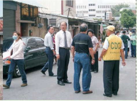
■ 視察登革熱孳生源查核情形

當然隨著高雄疫情升高，就在我們都記憶猶新的921各分局派員到高雄支援機動防疫隊，我和四分局幾位蟲媒相關疾病的主辦人一起到五分局開始分派後續的任務，接下來又重溫登革熱戰役的日子：同仁穿梭在巷弄間尋找孳生源、與當地居民溝通、每天評估各區塊的疫情……，只是這次是在次戰場看主戰場。