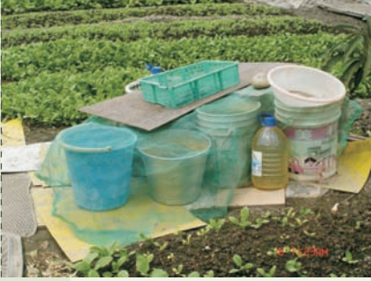
■ 於果菜園中，積水容器要加紗網或加蓋，以防病媒蚊孳生。