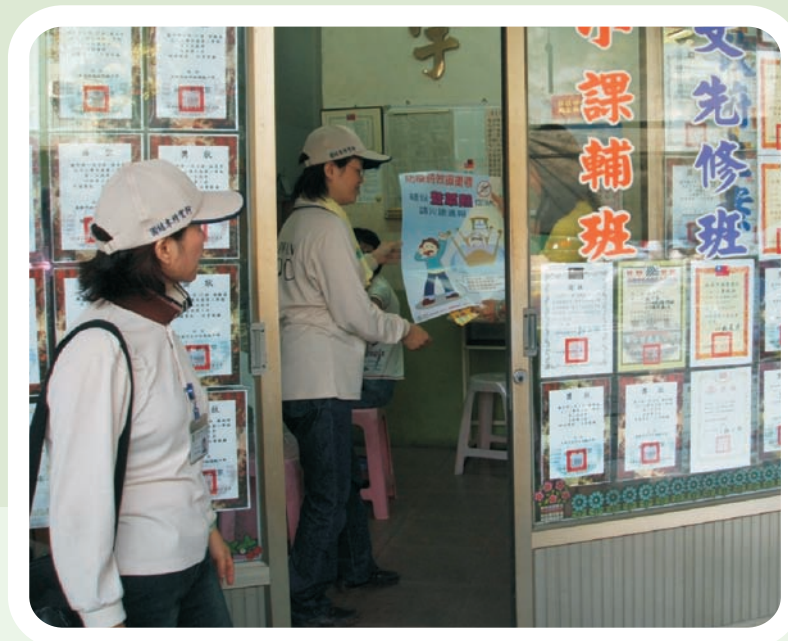
■ 發放登革熱防治宣導海報

隔天，鬧鐘準時在早上6點鐘響起，我開始了登革熱抗戰的第一天。帶著抖擻的精神、穿上黃色的戰袍，防疫機動隊出發了。我們頂著烈日，汗水乾了又濕、濕了又乾，在帽緣、黃衫上暈染成一條又一條的白色結晶；我們排除萬難，找尋孳生源攀高爬低，泥巴在手上、身上、衣服上毫不留情的遺下痕跡，甚至一不小心還會烙下傷口；我們不懼危險，為了疫情調查尋根究底，隊員通力合作周旋在任何可疑環