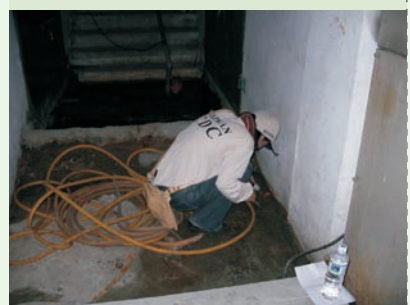
■ 地下室低窪積水之查核