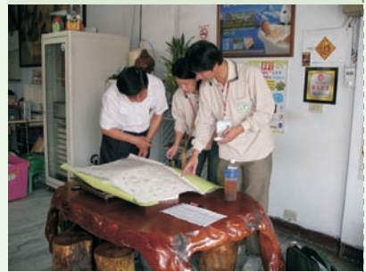
■ 尋根究底與里長評估溝通協調找孳生源

登革熱，儼然成為南台灣每年上演的大事件，維護社區環境整潔、家家戶戶清除孳生源不單是衛生單位的工作，更是每一個居民的責任，如何把登革熱防治深植南台灣居民的生活中是作好登革熱防治的首要工作。