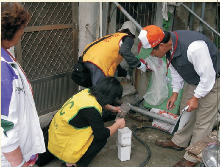
■ 登革熱孳生源查核