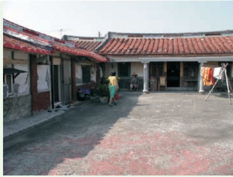
■ 大宅院登革熱孳生源查核