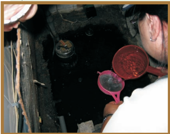
■ 發現子孳—地下室陰井積水孳生子孳

經由每次工作成果的呈現，發現自己也慢慢累積了很多有關登革熱防治知識及經驗，由於首長當機立斷成立「前進指揮所」，未讓疫情擴大，爲95年登革疫情畫下美麗句點，這次有幸能參與防疫機動隊雖然僅盡棉薄之力但頗有榮焉。