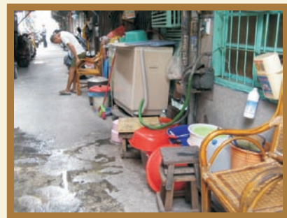
■ 住家外水桶水盆堆積