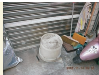
■ 水桶底易積水成孳生源

夢境中，我枯坐於一家雅名爲夢十三的茶坊裏啜茶品茗。鄰桌坐著一位長者叼起煙斗吞雲吐霧；另有四位年輕小伙子在玩撲克接龍的遊戲；而我在煙霧縹緲的薰陶下，思緒漸漸浮上我的心頭。首先，我夢裏相思的是十二生肖，當龍馬浮現出時，我童心未泯似的拿起圈圈丟擲將此二生肖套住，並將保麗龍碎粒點綴在龍頭、將馬桶置於兩腿站立的馬尾上，擺放於家中的櫥櫃觀賞。然後我夢遊於高雄市以數字命名的十條道路上，並衛星定位在六合與十全路，我魂縈舊夢憶起昔日攜帶糖果餅乾盒、戴上安全帽、騎著機車，先去逛六合夜市，再至母校高醫附近大學同學的家中談天說地的情景，就啞然失笑。而於夢中顯像與喃喃夢囈中，我聯想拼湊地將一品夫人與瓶瓶罐罐、廢電瓶；房貸二胎與廢輪胎；三綱五常與水缸、浴缸串連起來。