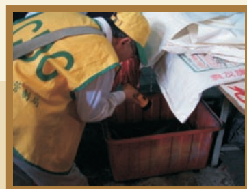
■ 積水容器尋找孑孓