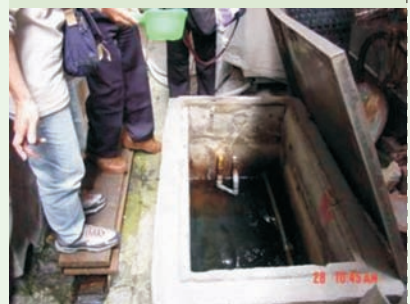
■ 又是三不管的陰暗角落的孳生源