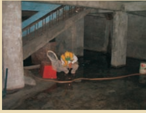
■ 地下室登革熱查核