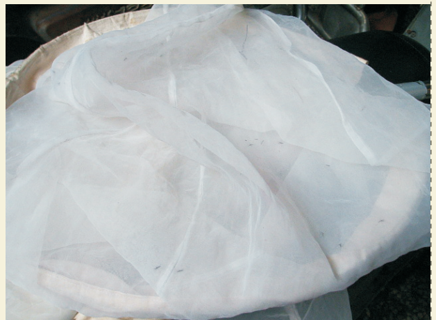
■ 掃蚊網—查核登革熱病媒蚊必備武器