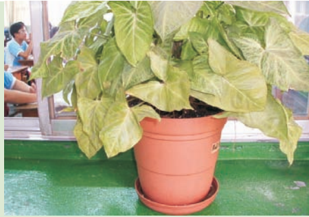
■ 孳生源—校園栽種花盆底座