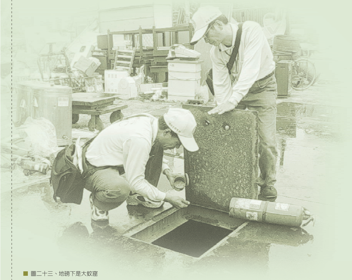
■ 圖二十三、地磅下是大蚊窟