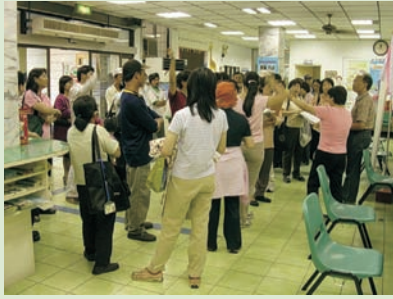
■ 圖四、前鎮區勤前教育