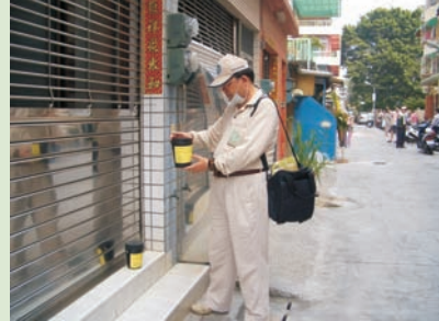
■ 圖八、檢視產卵筒功效

區的高風險，並且經由掃網發現家戶中的成蚊指數已高達0.15（圖三），更確認了林華里的緊急噴藥工作刻不容緩，從而也擬出「緊急防治現場藥效評估作業」，為爾後的藥效評估工作訂出規範。