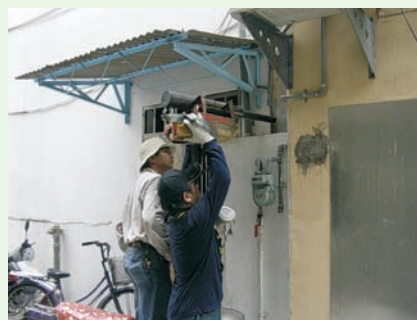
■ 圖十一、施噴封閉防火巷