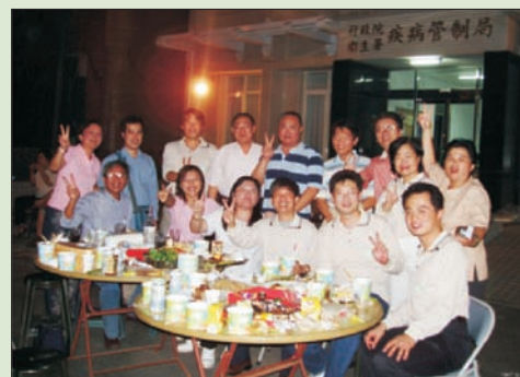
■ 中秋節夜晚同仁合照