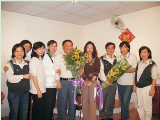
■ 感謝長官指導抗疫大計

有一個「累」字形容。每天都想疫情為什麼還沒有降溫，心理承載著莫名壓力，有人跟我說「每次一看到妳，身上好像有駝著千斤重的石頭，很沒精神」、「脾氣變糟了」等等，工作上的忙碌，真的讓人快樂不起來。「防疫視同作戰」，這是我們疾病管制局的精神標語，在95年登革熱戰役中，打了一場勝仗，就整個戰略上的運作、與地方溝通協調、物資的補充、人員車輛調度等等，整個運作流程及戰略規劃都非常順暢，都歸功施指揮官及楊副指揮官的領導，成功的控制了疫情，也打破四年大流行魔咒及選舉魔咒，完全不是經由老天爺的幫忙，使得個案數控制在1000例以下，比起91年的5000多例約是下降了6倍之多，這是值得嘉許的，但仍有再進步的空間。但隨著經驗的累積大家對防治登革熱疫情更有經驗，難保不會再有像91年的疫情，所以加強民眾對於住家環境清潔及孳生源清除衛教為首要工作，另，有疫情發生時落實各項防疫工作，以杜絕登革熱發生，雖然是老掉牙的宣導，但在執行上不是那麼容易，所以每年仍有登革熱疫情發生，只是期待在民國那一年由世界衛生組織宣布登革熱已經絕跡，南部地區民眾應大聲歡呼、慶祝，只是不知這一天什麼時候來臨。總而言之，大家都有心裏準備，只要天氣開始轉熱，大家心裏毛毛的，開始備戰，準備與蚊子展開「人蚊大戰」，當然最後勝利者會是我們，只是要嘗到勝利的滋味，需要付出很大的代價，不管是人力、財力、精神等等，所以大家有共同的想法就是「這兩隻蚊子還真難搞呢？」如何將登革熱杜絕進入在我們的生活中，仍需要大家共同努力。