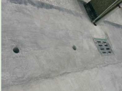
■ 圖七、人孔蓋加裝細紗網與圓形氣孔