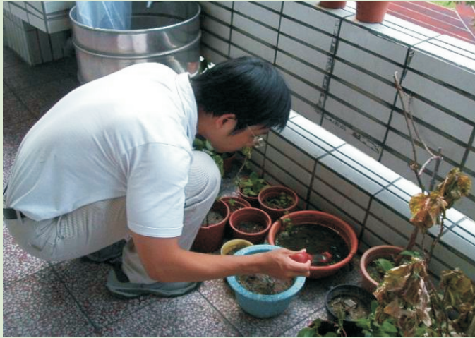
■ (左圖) 發現陽性容器