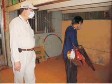
■ 圖六、現場指引輔導噴藥