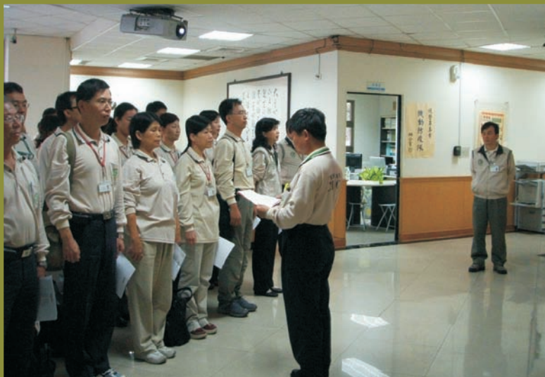
■ 機動防疫隊行前訓練