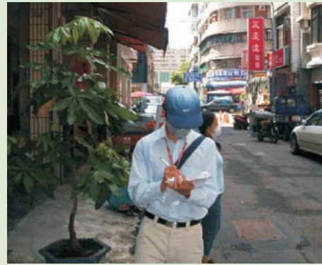
■ (右圖) 挨家挨戶埋頭苦幹查核工作