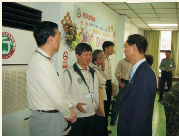
■ 與高雄市政府衛生局研商對策

登革熱於傳染病防治法中雖歸類為第二類法定傳染病，但卻是一種足以牽動政治經濟甚至國際聲譽的敏感性疾病。無怪乎上從行政高層以至地方政府、政治人物、媒體等等，均極高度關注防疫措施成效與疫情發展。95年為近10年來第二大流行疫情（91年居首有5336例，95年952例），雖然疫情規模難以與91年比擬，但若非中央、地方展現極高度合作機制，及早因應經由精準的疫情調查分析，科學的研判，行政體系靈活依法成立各層級「登革熱疫情防治中心」；防疫物資、人力的統籌應用，甚至動用國軍化兵群弟兄專業技術與機具長達一個月的支援，則絕無法達成如此優異的防疫成績。當疫情發生初期，雖然地方政府也依其訂定防治手冊展開相關作業，但事實上各