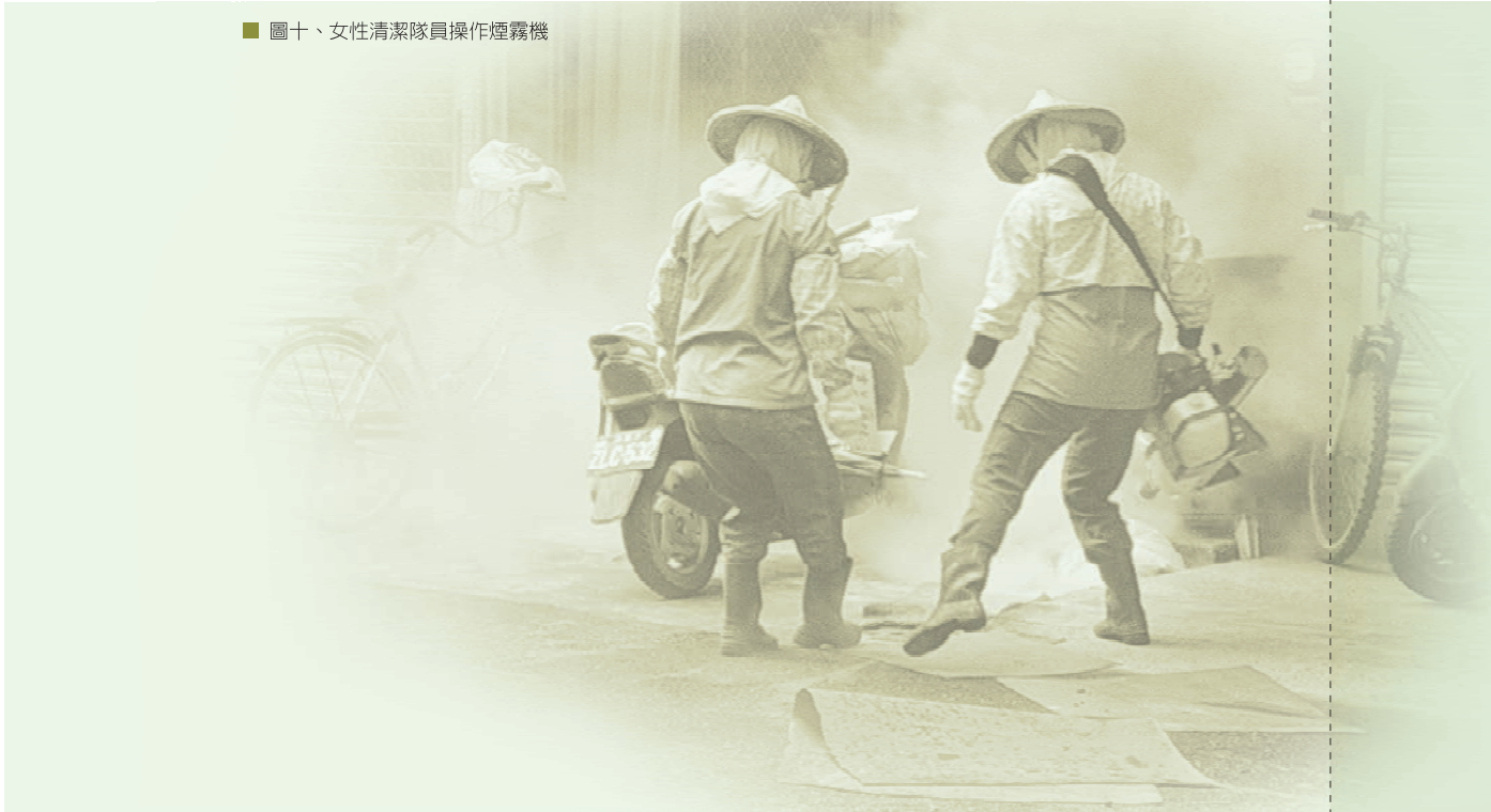
■ 圖十、女性清潔隊員操作煙霧機

當臨時保母），斑蚊野外（苓雅）品系終於建立完成。可惜，菜鳥剛磨成老鳥就要換班了。看著分局同仁與高采烈的互道珍重，咱們只有收拾起落寞的心情，期待「不要再相會」吧。