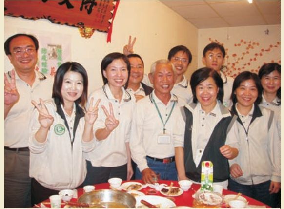
■ 吃飽了才有力氣繼續打拼

了解，誤以為與東部環境是一樣，忘了南部地區是登革熱病媒蚊的大本營，直到第28週陸續出現個案後才知道大事不妙，已有擴散的趨勢。相對的忙碌的生活開始一連串展開，包括資料的收集、疫情調查、病媒蚊調查等等，每天應接不完的工作，到後來疫情愈來愈嚴峻，整個心情更加沉重，像洩氣的皮球，挫折感很大。由於疫情擴散到其他縣市及行政區，因此分別在9月21日成立機動防疫隊協助地方孳生源查核工作；10月2日成立中央疫情指揮中心，由中央與地方政府共同防治登革熱疫情，這是我在四年的防疫生涯第一次體驗到依疫情需求，成立的疫情指揮中心及整個組織架構流程的運作，這都是很難得的經驗。另，95年的整個支援人力比起以往還要有規律，包括服裝儀容一致性、早上出發隊伍集合、唱局歌、出征前感性勉勵話語等等，大家感受頗深，整個作戰團隊讓人感覺我們是一支訓練有素的隊伍。也給縣市政府很好的榜樣，為提振士氣，高雄市政府由副市長率隊前來取經，運用在市政府組織團隊。