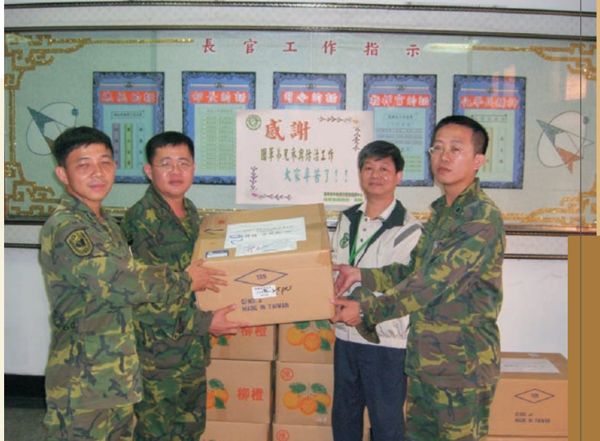
■ 代表署長感謝國軍弟兄支援致贈慰問品

單位卻各自為政，縱向、橫向間的命令流與訊息流紊亂，甚至為嚴重的亂流，大家忙亂成一團而事倍功半。前進指揮所統籌南台灣中央與地方各單位間防治機制，且隨著疫情演變，於戰略、戰術上靈活調整應用，最後將疫情鎖定在前鎮、苓雅、三民、鼓山（後來由小港取代）、鳳山等戰區。此五戰區前進指揮所由區（市）長擔任指揮官統籌指揮調度區內所有資源及與市府和中央指揮中心定期開會報告執行成果，另外衛生所所長、民政課長、清潔隊長則擔任幕僚提供區長防疫相關專業諮詢。前進指揮所則對應有五大戰區司令，個別負責與各戰區指揮官聯繫督導防治作業，及下達應辦理與改善事項。各戰區均定期實施區域大掃蕩及容器減量計畫，以及區塊完整的噴藥滅蚊作業。如此龐大困難的執行事項，區長均身先士卒親赴現場督軍，解決疑難。民政課長則動員里鄰長、里幹事、社區志工熱心人士參與及在場溝通協調；清潔隊長則親率隊員與各支援人員展開噴藥、清除龐大髒亂孳生源、積水地區疏通、防火巷堆置廢棄物清運等艱苦工作。衛生局所人員則依疫情畫定防疫區塊，挨家挨戶執行三合一工作，面對民眾之抗爭抱怨阻撓甚至暴力威脅，除婉轉說明及依法執行外，也得力於警察人員，全程支援維護執法與工作人員安全。除每日定期開會檢討外，各戰區的司令與指揮官更隨時通聯或親至現場勘查研商對策。而機動防疫隊每日查核成果與應改善