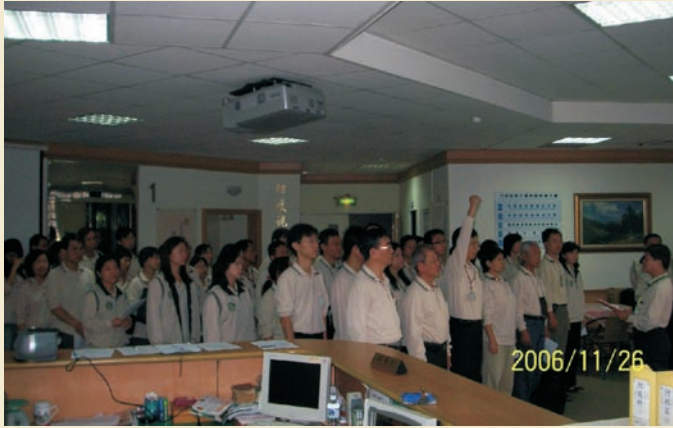
■ 全體隊員每日上午8點整於前進指揮所點名並分配任務