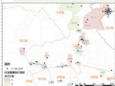
■ 將發病個案標示於地圖