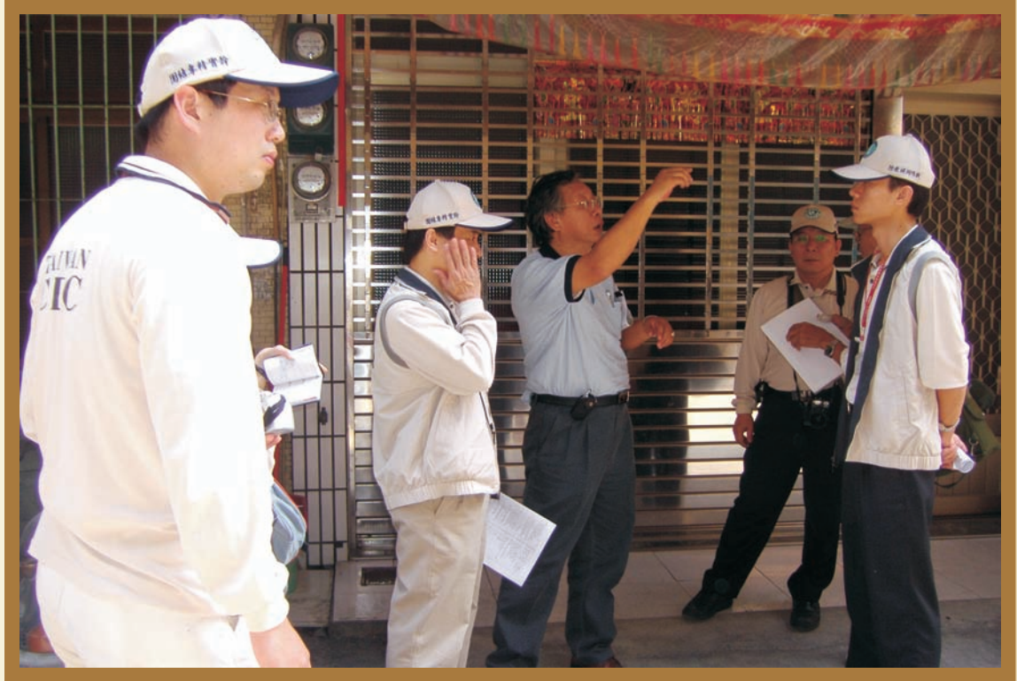
■ 與指揮官會勘社區

疫情調查之流行病學資料，此外，整合高雄縣、市衛生局散發區個案的管理，明瞭衛生局、所對於散發區個案的掌握及防治之現況、進度，以及記錄工作執行之問題與困難並提供建議改善之方案。