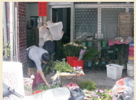
■ 圖一、花店抓到成蚊 ■ 圖二、排水溝中發現斑蚊