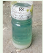
■ 圖十五、燃油與藥劑混合沉澱