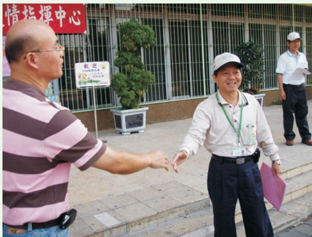
■ 至前鎮戰區關切防治成果

衛生環保本同源，無奈數年來因登革熱防治業務互有區隔，甚至有各行其是的情況，然而登革熱卻是一社區病也是一種環境病，其根源為民眾居家與週遭散佈的積水容器。當疫情發生後雖然衛生體系傾全力執行三合一防治工作，其中孳生源清除為首要之務，但是若只由衛生局所同仁畢竟難以盡其功。甚至戶外及防火巷、空地的噴藥滅蚊，以及空地空屋大型髒亂孳生源的清除，