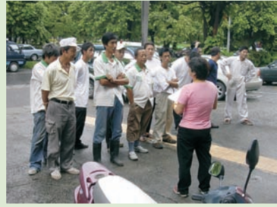
■ 圖五、噴藥人員技術指導