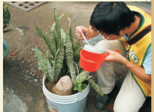
■ 花盆內發現孑孓！這可是要睜大眼睛才看得到喔！