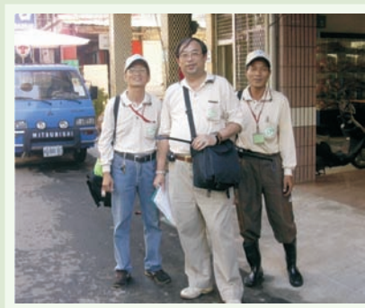
■ 圖二十四、流浪三兄弟

換防前，施指揮官一句「感想如何？」；真是千言萬語、不知從何說起；似此面對疫情，硬碰硬的實戰經驗，同仁們天天生活在一起、戰鬥在一起的革命情感，雖然只有短短一月，但其中的趣聞軼事與情誼卻能教人懷念一輩子。倉促之中，只得一句「我的台語又更上一層樓了」，其它的，只能說予後人聽了。