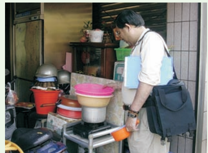
■ 圖十七、鍋碗瓢盆孳生子