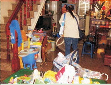
■ 圖三、家戶中調查成蚊指數