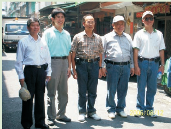
■ 楊副指揮官率員至前鎮區督導防疫業務