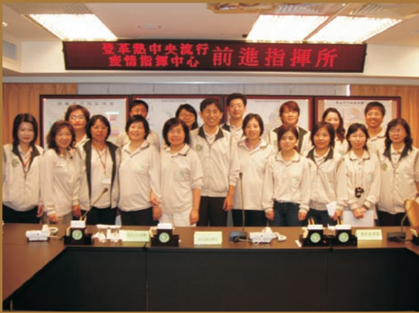
■ 前進指揮所同仁合照