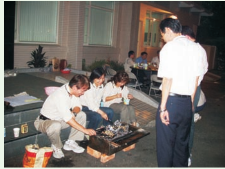
■ 中秋夜同仁於分局前空地烤肉活動

交通工具乃是執行登革熱疫情重要工作一環，因分局公務車輛有限，惟每日需調派出勤疫調、長官同仁之外出會議、巡視、觀摩及接送各方支援人力等，均需龐大車輛因應。為解決川流不息之交通問題，除分局自有公務車外，另向租賃公司租車及計程車行，以記帳方式每月結帳辦理核銷。本項措施耗費採購同仁每月之核對，倍亟辛勞。