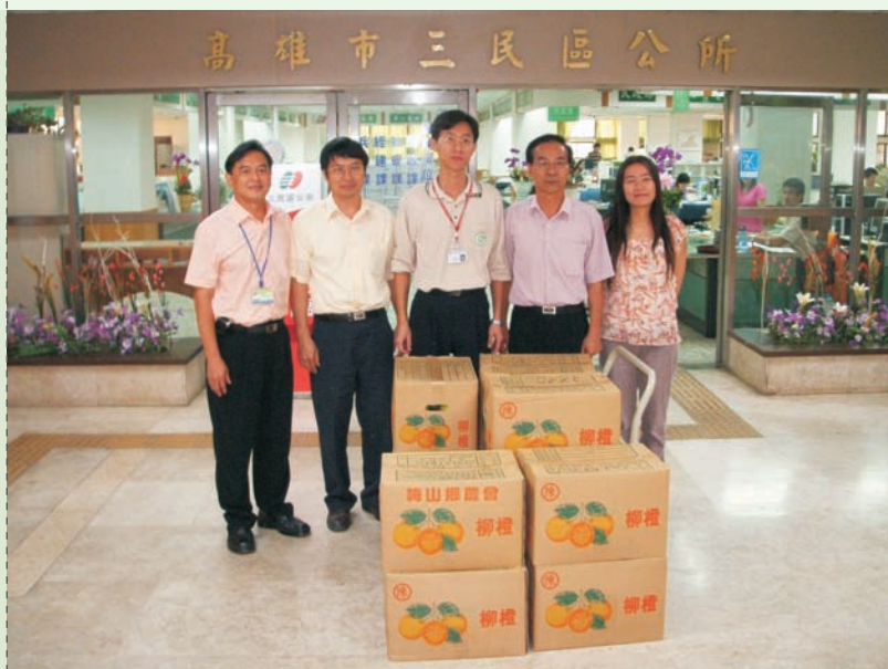
■ 至三民區公所轉贈侯署長慰勉地方辛勞之水果

幸運的是在95年的這場戰役中，我們看見行政主管者主控疫情的角色發揮的淋漓盡致，雖然仍是沿用由縣市首長或副首長擔任抗登革防治中心召集人的模式，但在進一步執行防治作為時，卻將權力下放至各行政區，這種由行政區區長直接擔任疫情所在地指揮官，直接統轄區內環保及衛生兩單位攜手並行的模式，的確是前所未見也發揮了極大的成效。身為感染科醫師的我，對於這種防治模式的確感觸良多。因為在執行院感措施時，大家似乎都容易忽略了行政管理者應有的角色，反而過於強調將此重責大任委由感控人員承擔，這不但會有事倍功半的成果，對於身為幕僚的感控人員也是不可承受之重。試想在龐大