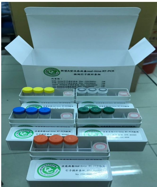
圖 2、107 年新型 A 型流感指定檢驗機構網絡圖