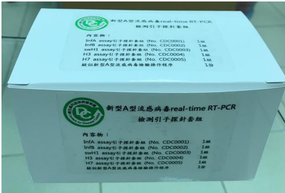
(B) 檢驗套組內容物圖