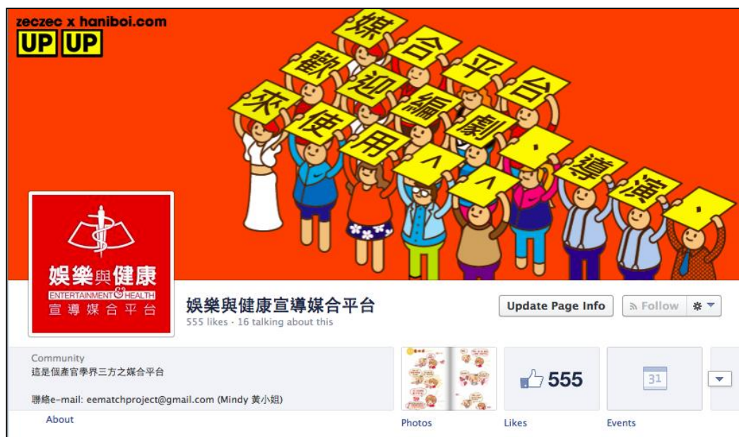
圖六 「娛樂與健康宣導媒合平台粉絲團」入口頁面

由於本計畫的粉絲團為非營利性質，作為一個維繫編劇與平台間「紐帶」的非正式組織，主旨乃在提供、提高戲劇產製工作者亦或製作人、導演們獲得疾病資訊以及尋求媒合服務的平台，經營方面著重定期更新資訊，提供媒合服務聯絡方式，而成員們與管理者們互動方式多以回覆貼文訊息、按讚、分享三者居多。本平台臉書粉絲團之入口頁面如下圖（見圖六），網址為： https://www.facebook.com/matchproject?ref=hl