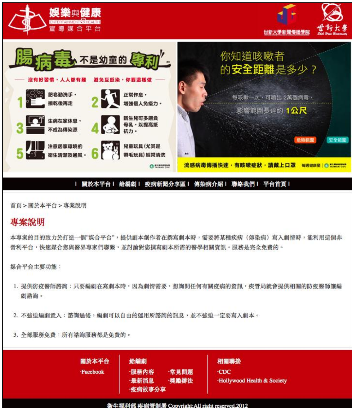
圖四 「娛樂與健康宣導媒合平台」入口首頁