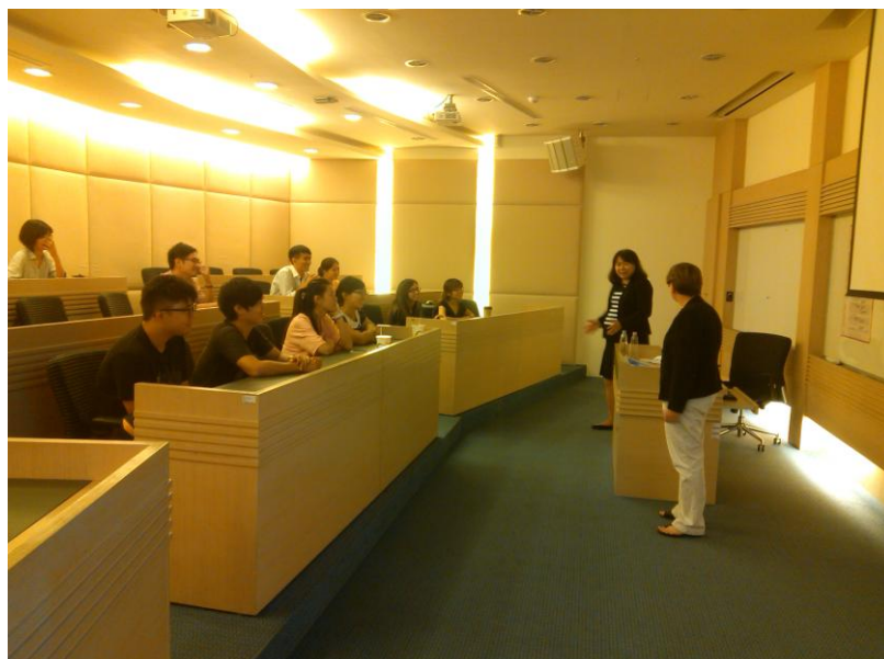
圖八 國際交流工作坊實況

整體來說，透過此次國際交流工作坊的活動，讓媒合平台以及國內的從事戲劇製作的專業人士，有機會與國外從事宣導工作的學者們交換意見，讓我們知道「他山之石」的樣貌，截長補短，希望未來媒合平台的任務，可以更加貼近編劇的需求以及達到傳遞重要疫病資訊的目標。