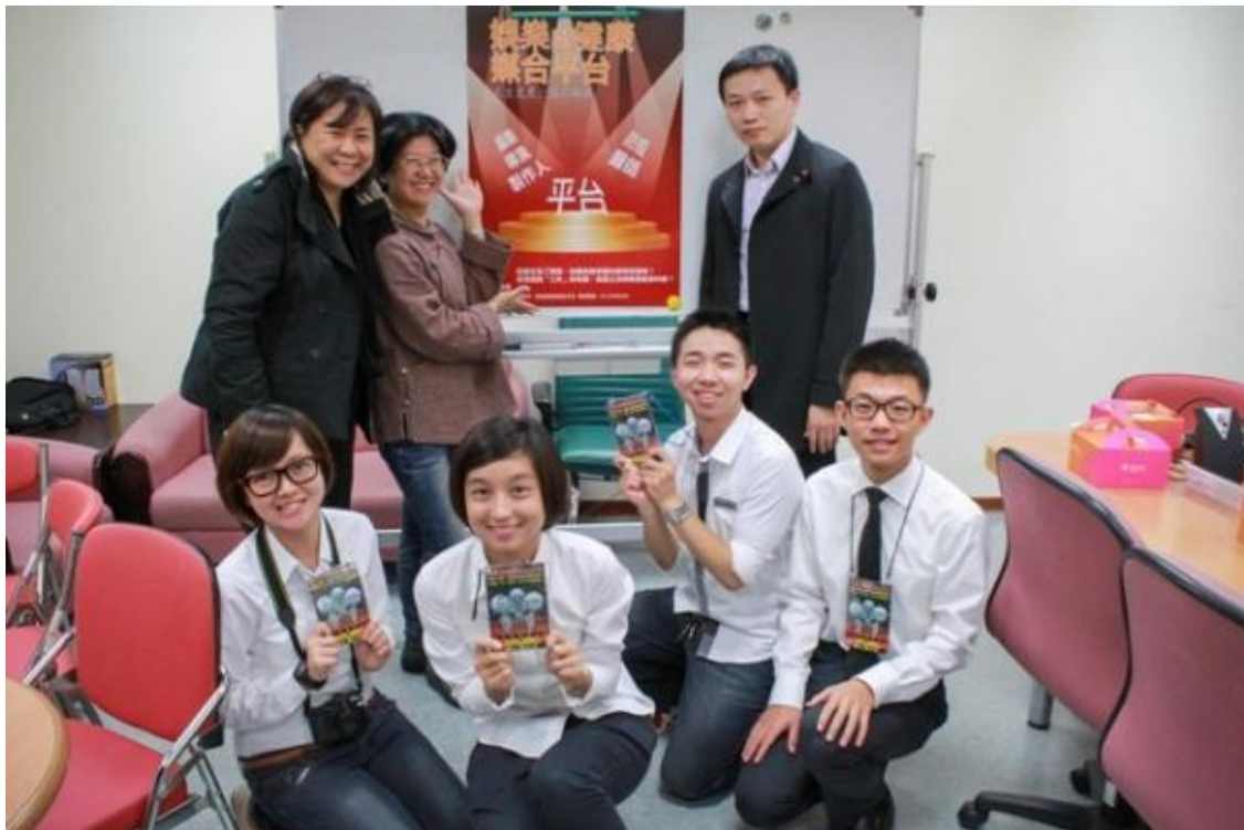
圖為工作坊團隊希望幫助有潛力的創作人才找到新的劇本素材。