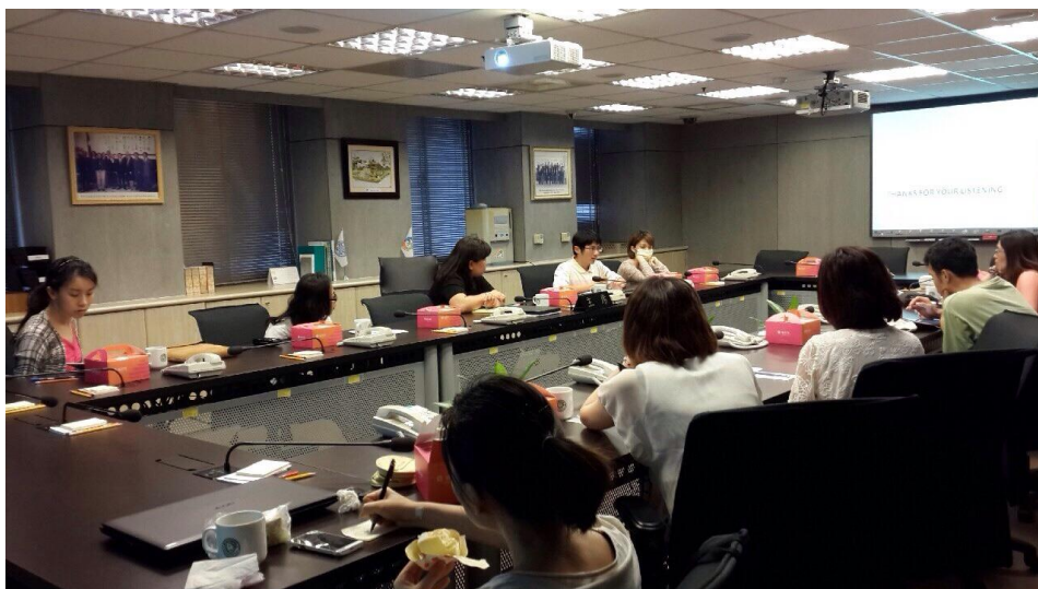
圖七 疫病故事工作坊「愛滋疫病故事分享」實況

第三場次於 3 月 27 日在疾管署舉辦「愛滋疫病故事分享」，計有 9 位編劇及導演與會；第四場次於 5 月 7 日下午四時三十分於疾管署之「《全境擴散》疫病電影賞析」，有 5 名編劇與會；第五場次於 6 月 4 日舉辦「流感疫病故事分享」，計有 7 名編劇及導演與會；第六場次於 7 月 16 日舉行，主題為「《鐵線蟲入侵》疫病電影賞析」，有 8 位編劇及導演與會；第七場次於 10 月 15 日辦理「人畜共通疫病故事分享」，共 9 位編劇及導演與會。7 場疫病故事工作坊，一共吸引計 82 人次國內資深或新銳劇作家與會，疫病故事工作坊會議記錄可參考歷年報告，相關實況見下圖（ 圖七 ）。